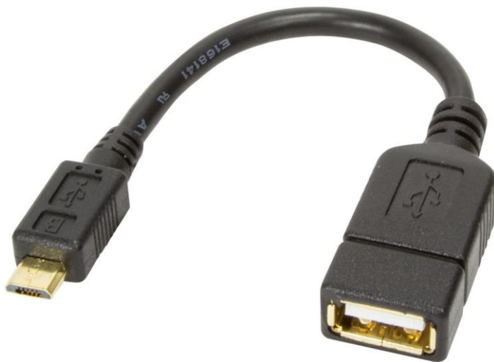
Abb. USB OTG Kabel

Es wird ein Micro USB OTG Kabel benötigt (siehe Abbildung). Schließen Sie das OTG Kabel und den USB Stick an das Gerät